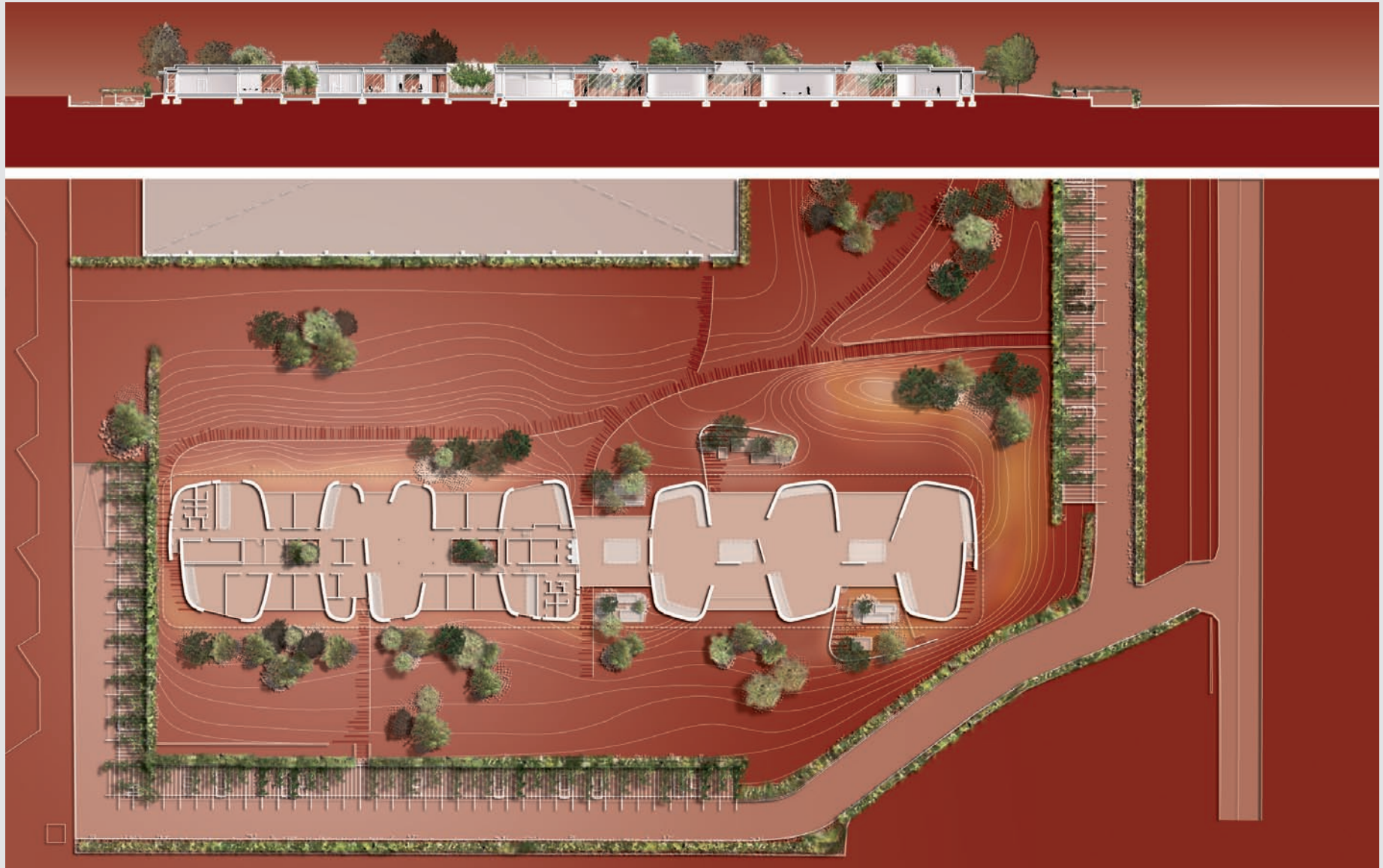
ARPER - TREVISO